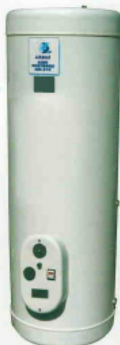
EAU CHAUDE SANITAIRE "COBAL" INOX AISI 316L 200 ET 300 LITRES