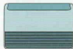
VENTILO-CONVECTEUR "CIRCULATION D'EAU"